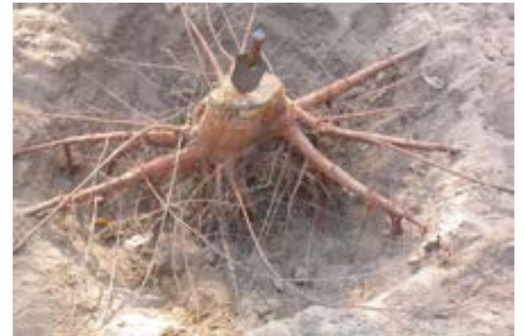
La base d'un système racinaire d'eucalyptus de 4 ans

Les racines sont au centre de nombreuses questions en agronomie et écologie. Pour y répondre, le développement de modèles pour la simulation sur ordinateur constitue une approche complémentaires aux expériences sur des plantes réelles.