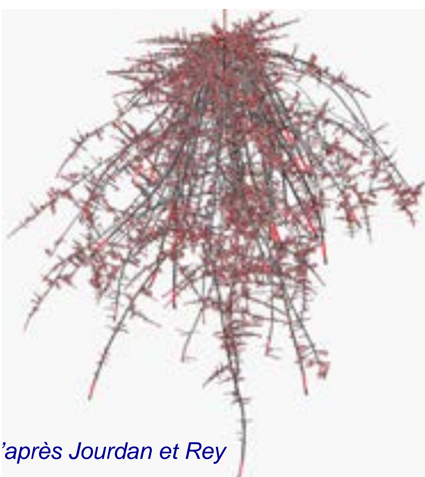
D'après Jourdan et Rey

Simuler consiste à utiliser un programme informatique qui exécute le modèle pour répondre aux questions posées.