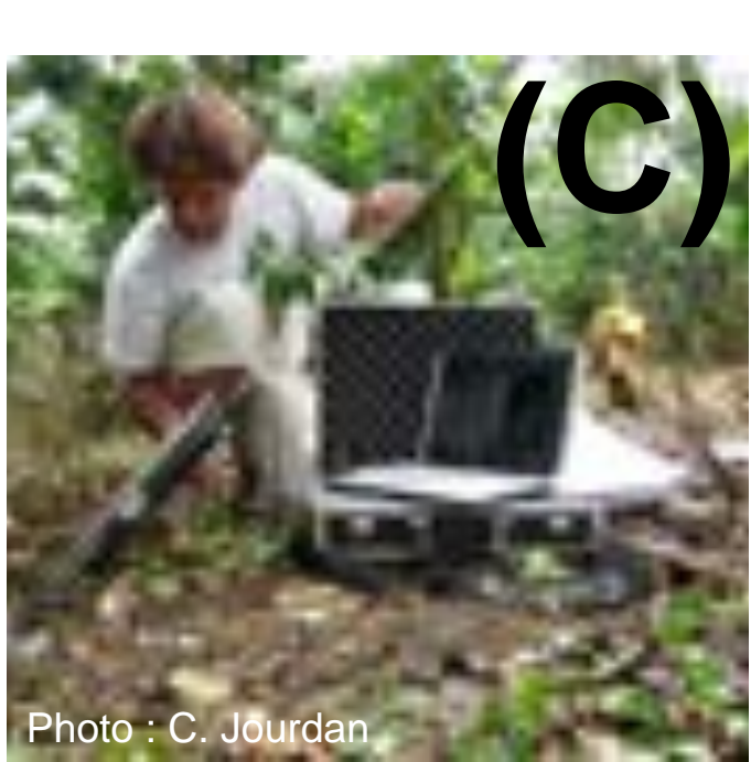
Utilisation d'un minirhizotron pour étudier les racines.