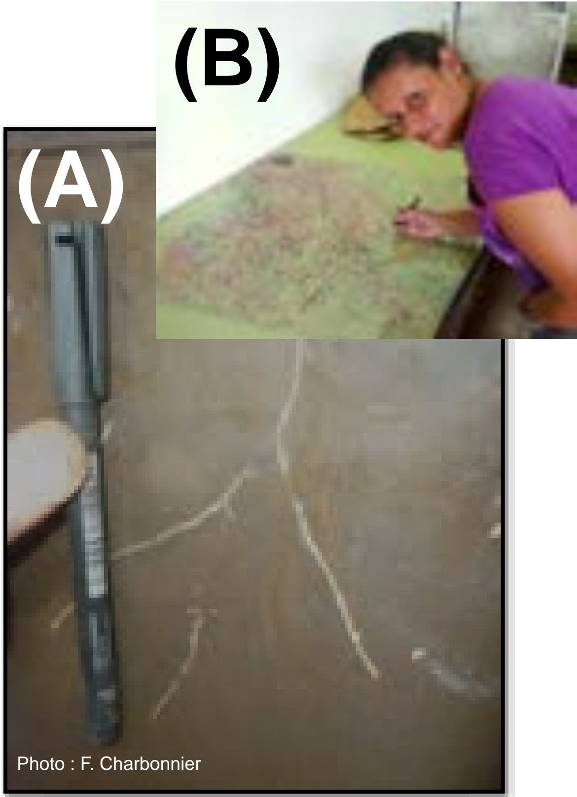
Racine de caféier observée à travers un rhizotron, et dessin issu des observations.

Tout comme les feuilles des arbres, je meurs et me renouvelle régulièrement, afin d'aller chercher de l'eau et nutriments dans des horizons de sol encore non explorés. Ma croissance et ma mortalité peuvent être directement observées dans le sol grâce à des vitres transparentes que l'on appelle rhizotron (A, B) ou minirhizotron (C, D). En mourant, la matière dont je suis constituée - principalement du carbone - est décomposée par les microorganismes du sol. Une partie de mon carbone retourne dans l'atmosphère sous forme de dioxyde de carbone (CO 2 ), et une autre va rester dans le sol, sous forme de matières organiques (E).