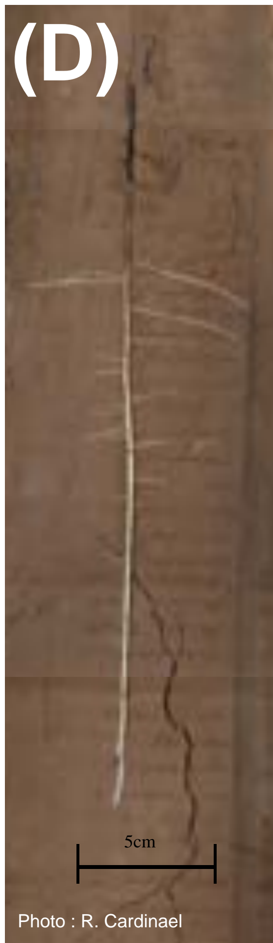
Croissance d'une racine de noyer observée à 3 m de profondeur à travers un minirhizotron.

En profondeur, je vis beaucoup plus longtemps, et la matière organique se décompose moins vite. Ainsi, plus je pousse profondément (F, G, H), plus mon carbone restera longtemps dans le sol...!