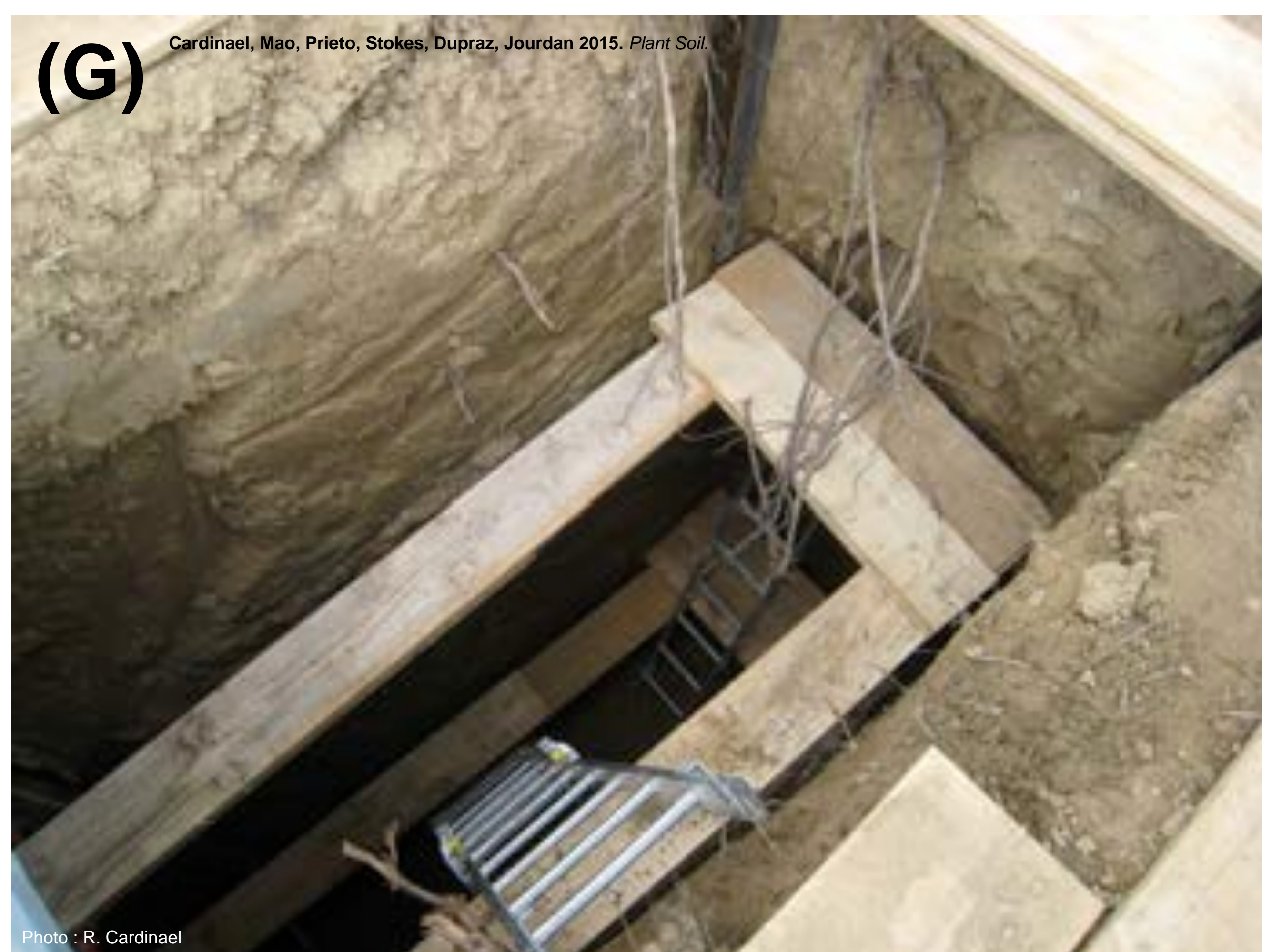
Fosse d'étude des racines de noyers dans un système agroforestier (France).