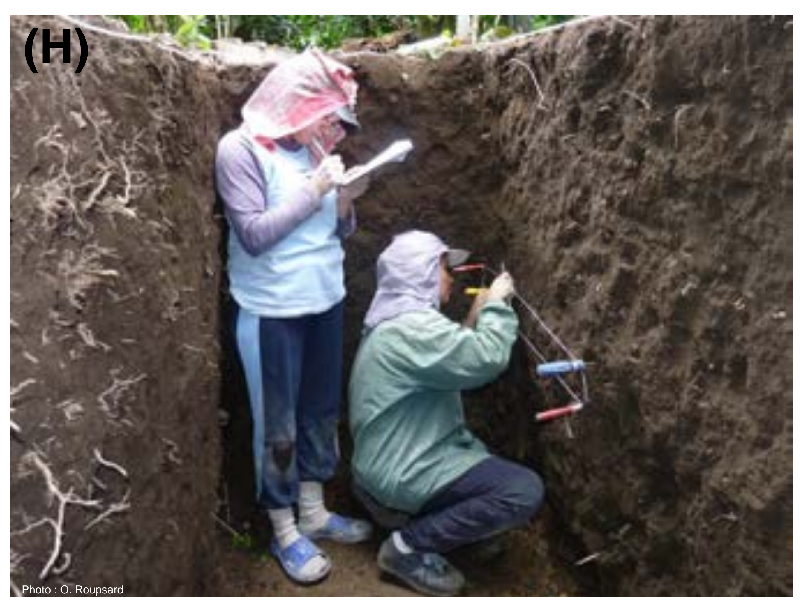
Comptage des racines de caféiers dans un système agroforestier tropical (Costa Rica).